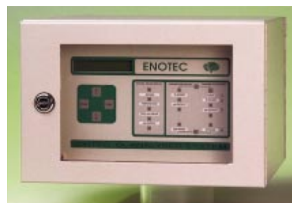
Abb. 2 OXITEC® Elektronik

Eine Übersicht über die Vorteile von OXITEC® 3000 gibt Tabelle 2.